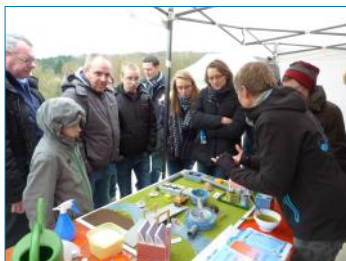
Animation CRSenne - STEP Hain - IBW

A l'occasion de la Journée mondiale de l'eau le 22 mars, le groupe de travail sensibilisation du Contrat de Rivière Senne organise chaque année une série d'activités liées à l'eau. Celles-ci se sont déroulées du 13 au 27 mars 2016 . Elles s'adressent à la fois aux écoles mais aussi au grand public et sont entièrement gratuites !