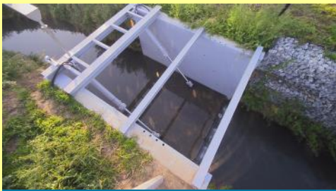
Système de gestion automatisé

La zone d'immersion temporaire a été récemment optimisée puisque le système de gestion, entièrement automatisé et informatisé, a été complété d'une caméra et d'un phare d'éclairage pouvant être commandé à distance. Cette ZIT située à côté de l'entreprise UCB à Braine-l'Alleud peut atteindre une capacité de 43 000 m 3 . Le débit de fuite correspondant au fonctionnement de la vanne a été fixé à 4m 3 /sec ; les débits supérieurs seront donc écrêtés mais ce chiffre est modulable en fonction du retour d'expérience. Les travaux ont été réalisés et pris en charge par la Direction des Cours d'Eau Non Navigables du SPW.