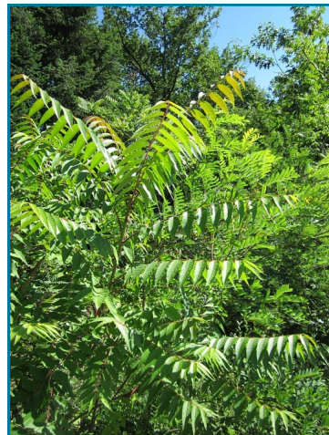
Ailante glanduleux ou faux vernis du Japon

Pour en savoir plus sur les obligations liées à ce Règlement européen , rendez-vous sur le site http://biodiversite.wallonie.be sous l'onglet « Invasives - Règlement européen ».