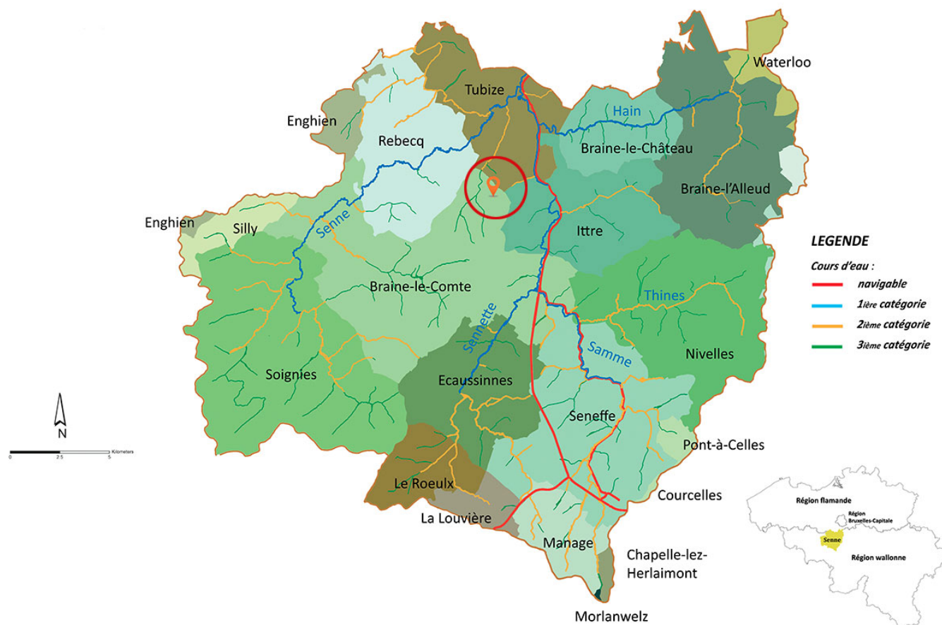
Carte de localisation du Grand Bois commun