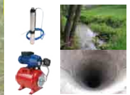
Pompe immergée ou groupe hydrophore