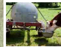
Tonne à eau