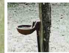
Eau de conduite