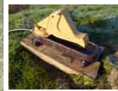
Pompe à museau